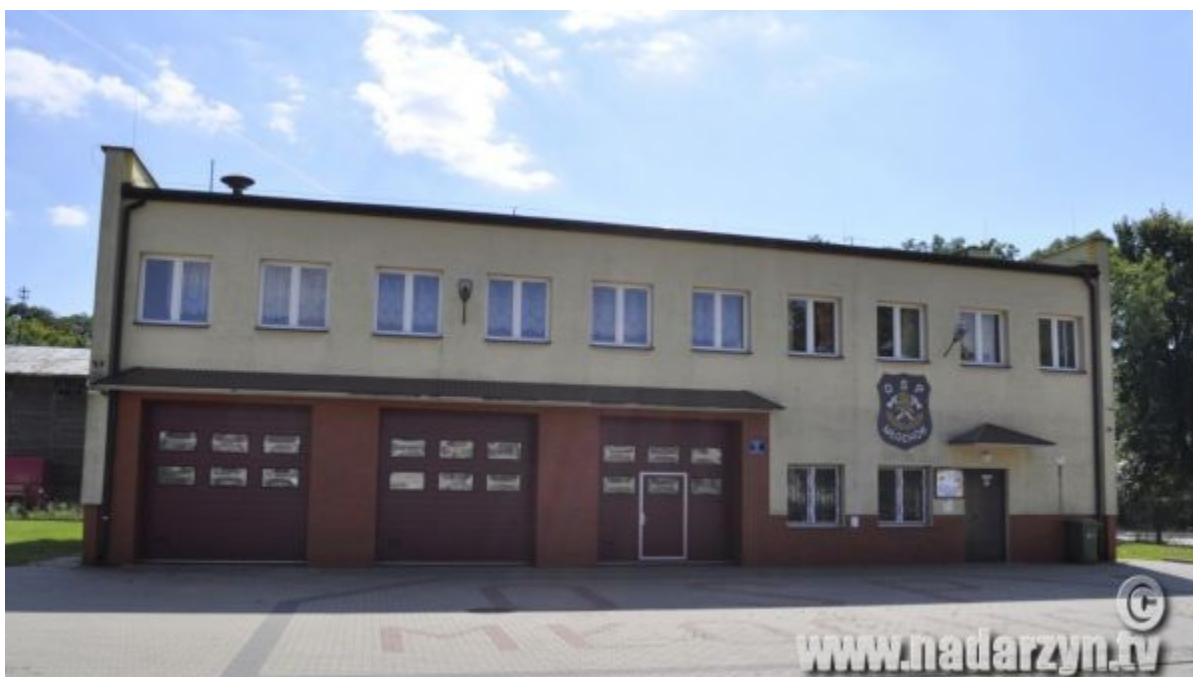
Budynek OSP Młochów

Mamo/Tato porozmawiaj z dzieckiem na temat miejsca w którym mieszkacie. Może nazwa miejscowości związana jest z jakąś legendą. Wyjaśnij dziecku, że zdjęcia poniżej przedstawiają budowle które znajdują się w różnych miejscowościach na terenie gminy Nadarzyna. Pozwól dziecku odgadnąć nazwy tych budowli i miejscowości, w których te budowle się znajdują. Porozmawiajcie na temat tych ważnych miejsc użyteczności publicznej. ( Urząd Gminy, szkoły, przedszkola, domy kultury, świetlice wiejskie, ośrodki zdrowia, komisariat policji, straż pożarna i inne).