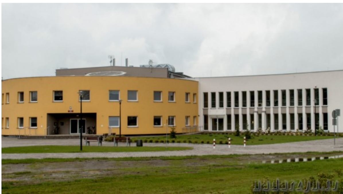
Szkoła Podstawowa w Ruścu