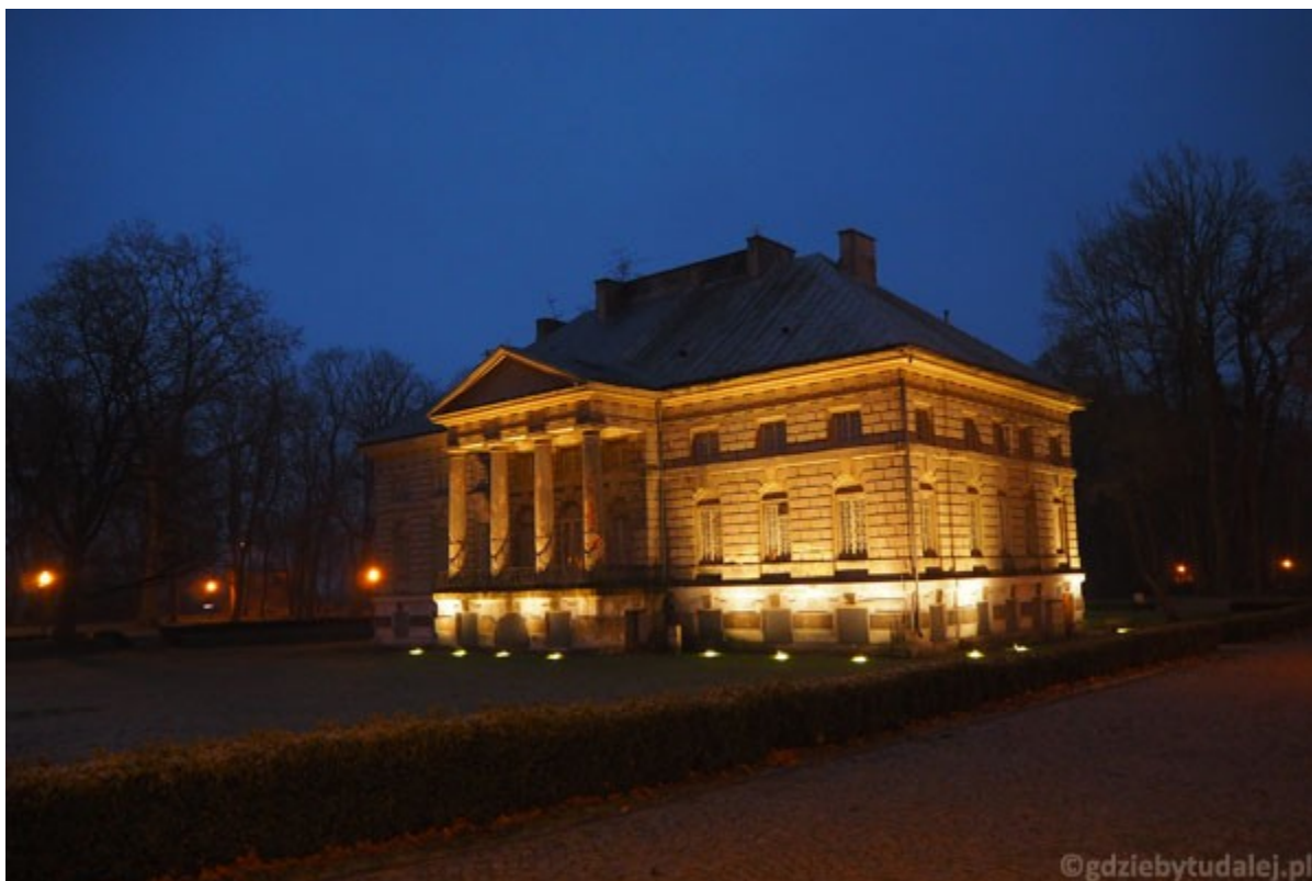
Pałac w Młochowie nocą

https://mazowieckie.dipp.info.pl/baza-dipp/item/321-gmina-nadarzyn/170-palac-mlochow