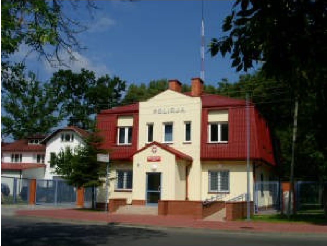
Komisariat Policji w Nadarzynie