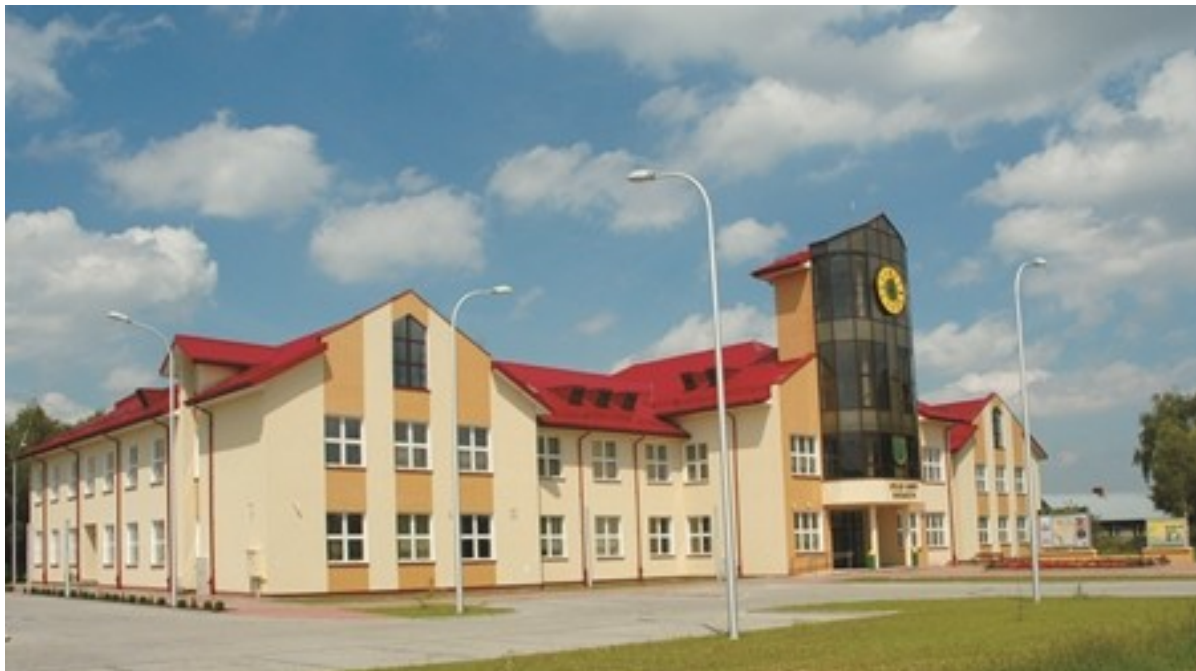
Urząd Gminy Nadarzyn