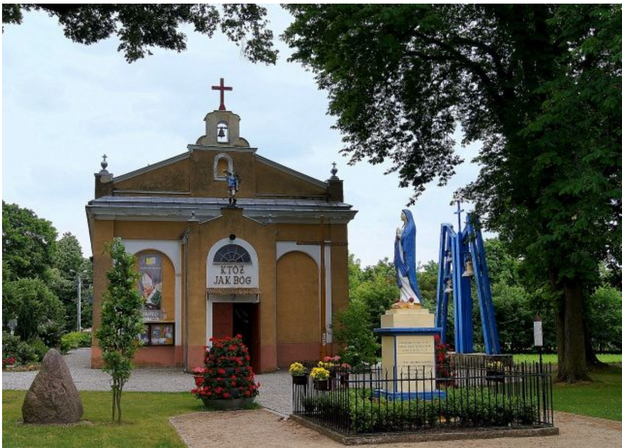
Kościół św. Michała Archanioła w Młochowie