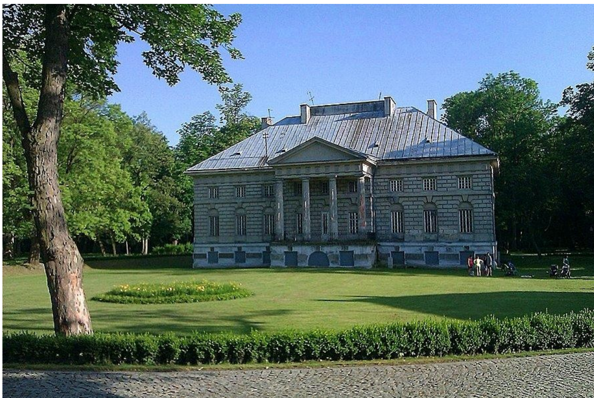
Pałac w Młochowie

https://mazowieckie.dipp.info.pl/baza-dipp/item/321-gmina-nadarzyn/170-palac-mlochow