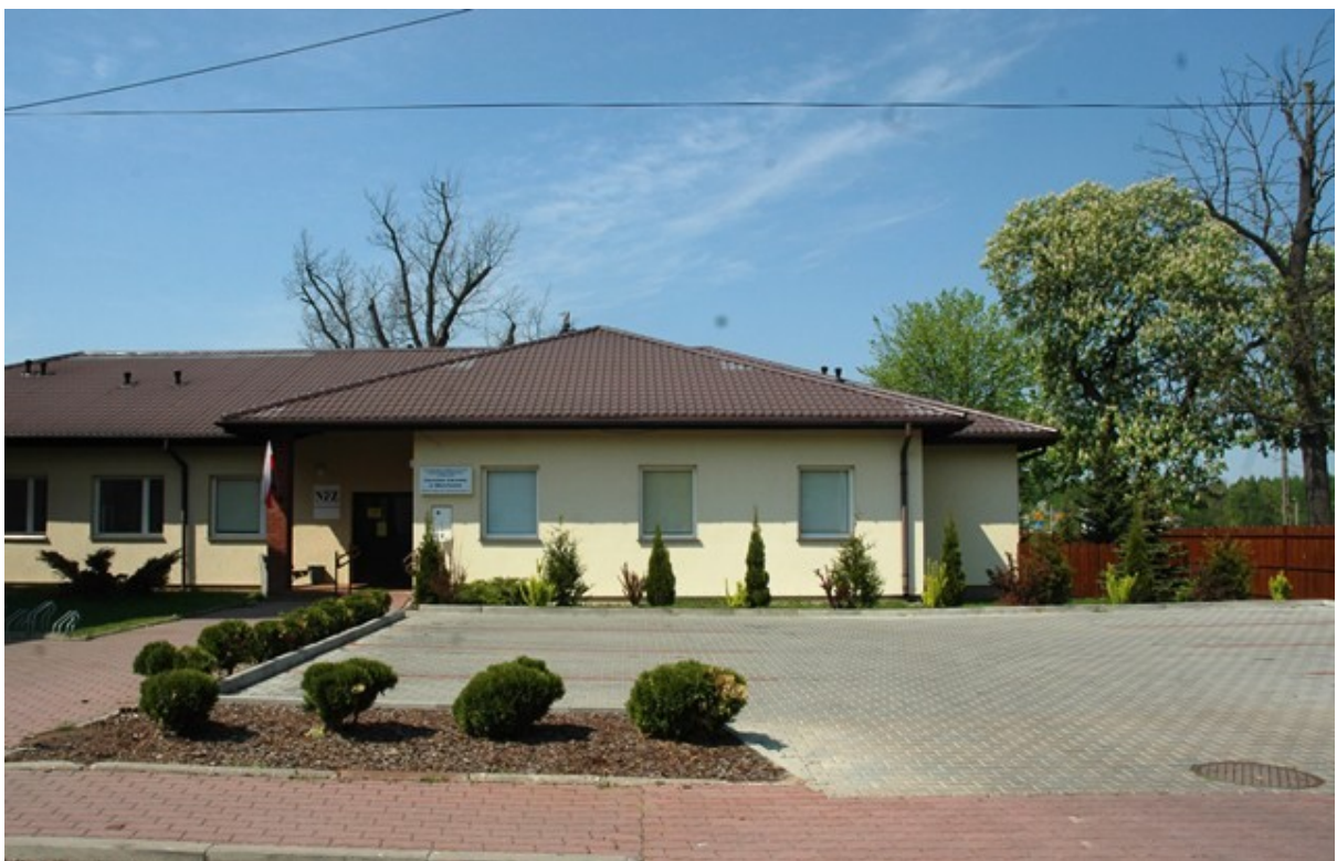
Ośrodek zdrowia w Młochowie