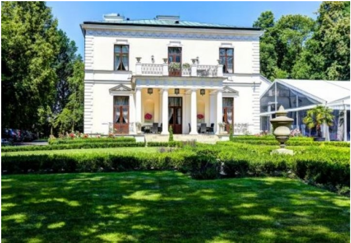
Pałac w Rozalinie