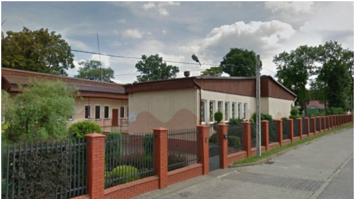
Publiczne Przedszkole w Młochowie