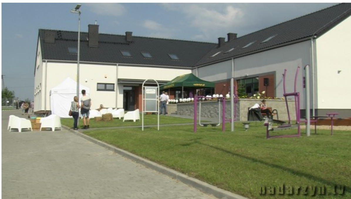
Świetlica w Parolach