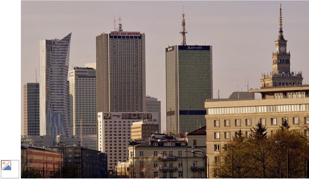
Wieżowce (drapacze chmur)