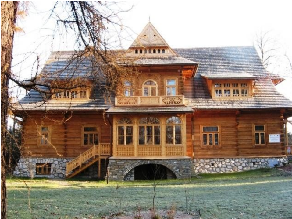
Dom w stylu góralskim