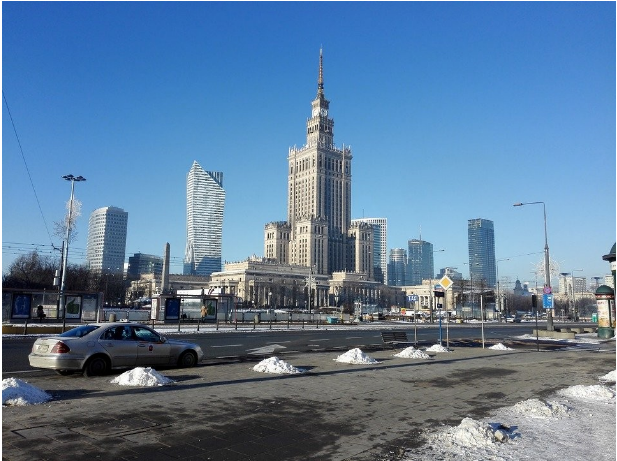
Pałac Kultury i Nauki