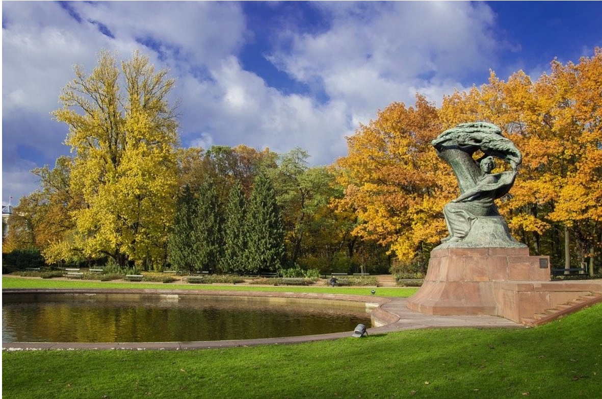
Łazienki Królewski - Pomnik Chopina