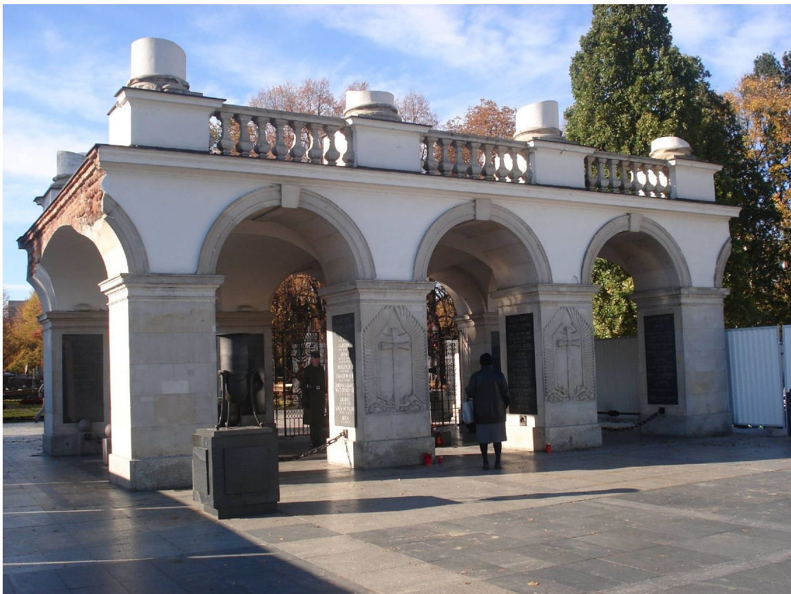
Grób Nieznanego Żołnierza