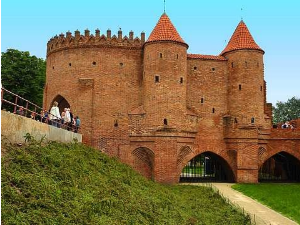
Warszawa - Barbakan