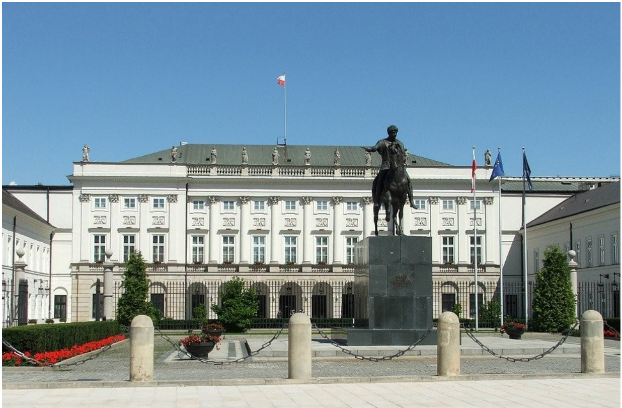
Krakowskie Przedmieście - Pałac Prezydencki