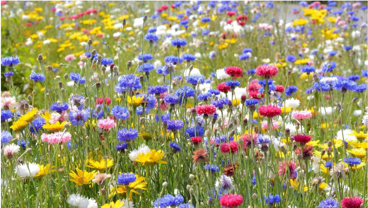
Obrazek przedstawiający ukwieconą majową łąkę.