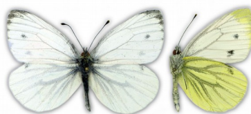
Bielinek bytomkowiec (wierzch i spód)