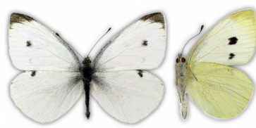
Bielinek rzepnik (wierzch i spód)