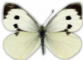
Bielinek kapustnik (samica)