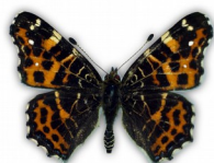
Rusałka kratkowiec (forma wiosenna)