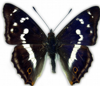
Mieniak tęczowiec (samiec)