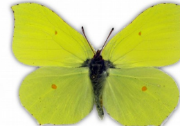
Latolistek cytrynek (samiec)