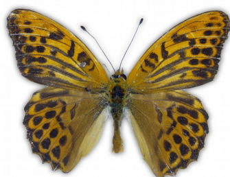
Dostojka malinowiec (samiec)