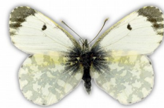
Zorzynek rzeżuchowiec (samica)