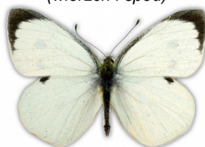
Bielinek kapustnik (samiec)