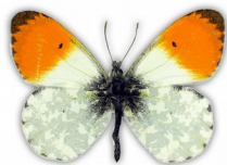
Zorzynek rzeżuchowiec (samiec)