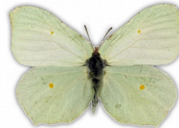
Latolistek cytrynek (samica)