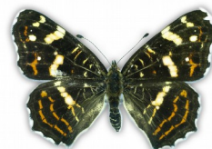
Rusałka kratkowiec (forma letnia)